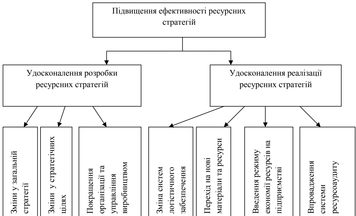
Рис. 2. Граф – дерево цілей підвищення ефективності ресурсних стратегій

Також не слід відкидати і варіант, який не передбачає ніяких дій з боку керівництва щодо покращення розробки ресурсних стратегій.