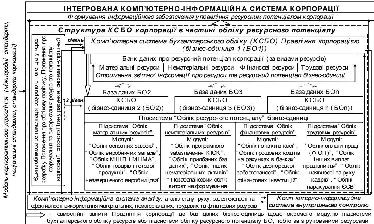
Рис. 2. Організаційна модель бухгалтерського обліку ресурсного потенціалу в умовах побудови інтегрованої комп'ютерної інформаційної системи корпорації