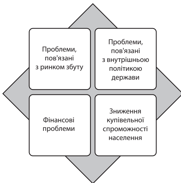
Рис. 3. Проблеми розвитку кондитерської галузі України

того, серед переваг українських виробників можна виділити якість продукції, увагу до оновлення асортименту, вивчення попиту на зовнішніх ринках та вдосконалення дизайну продукції.