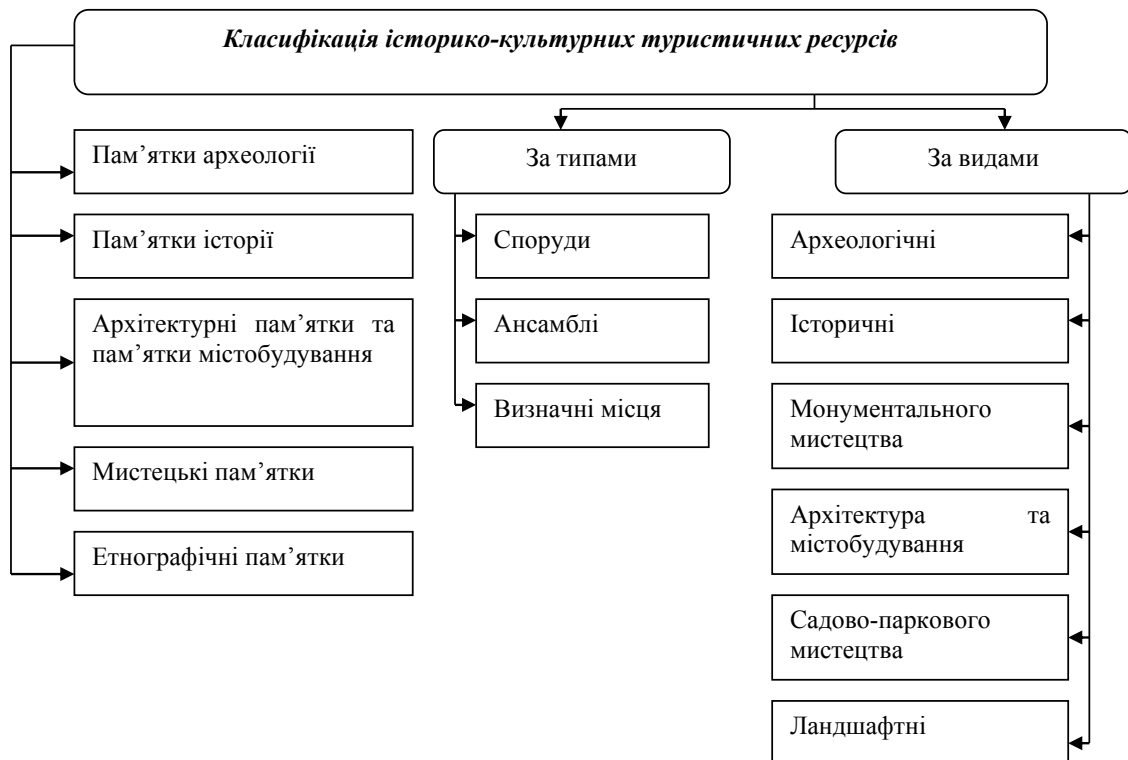
Рис. 1. Класифікація історико-культурних туристичних ресурсів