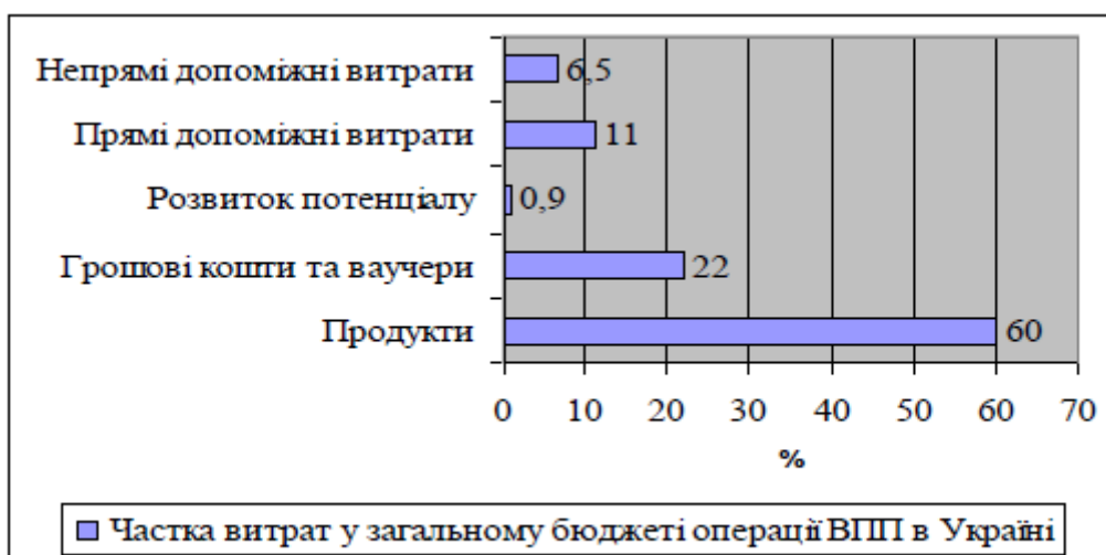
Рисунок 1. Динаміка загального бюджету екстреної операції ВПП в Україні

За результатами аналізу обсягів фінансування ВПП операцій в Україні визначено, що загальний бюджет екстреної операції ВПП щодо надання надзвичайної допомоги мирним жителям, які постраждали в результаті конфлікту в Україні, змінювався декілька разів упродовж 2015 р. Якщо на початку здійснення цієї операції запланована сума фінансування була встановлена на рівні $17 млн, то згідно з новим переглянутим бюджетом до 30.06.2016 р. ця сума наразі становить $91,9 млн (рис.1). З 2014 р. загальний бюджет екстреної операції ВПП в Україні збільшився майже у 5,5 разів.