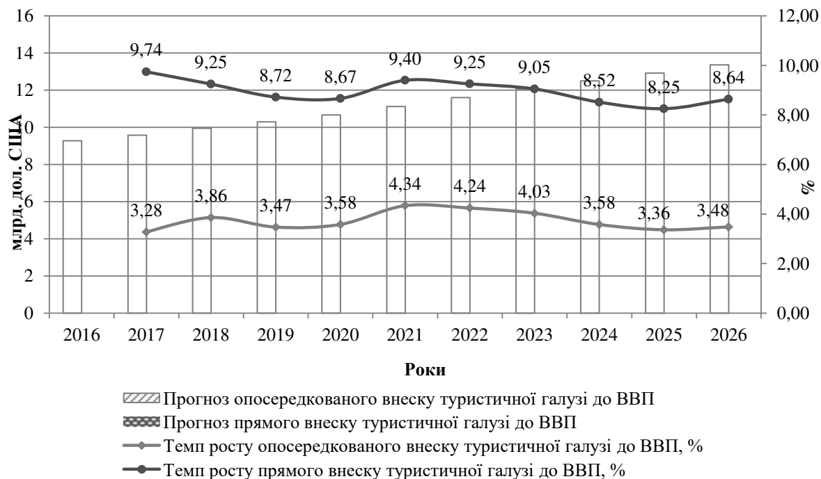
Рисунок 3 – Прогноз внеску туристичної галузі України до ВВП, 2016–2026 рр.

Ключовим показником впливу туристичної галузі на соціально-економічний розвиток є внесок туристичної галузі України до ВВП (рис. 3).