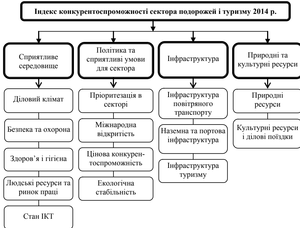
Рис. 2. Складові Індексу конкурентоспроможності країн у секторі подорожей і туризму 2014 р. (адаптовано автором за даними [3])

Оцінки в балах присвоюється індикаторам в межах інтервалу від 1 до 7, причому оцінка «7» відповідає максимально можливій. Кожна із 14 складових розраховується як незважене середнє значення окремих змінних складових (індикаторів). Субіндекси, у свою чергу, розраховуються як незважене середнє відповідних складових.