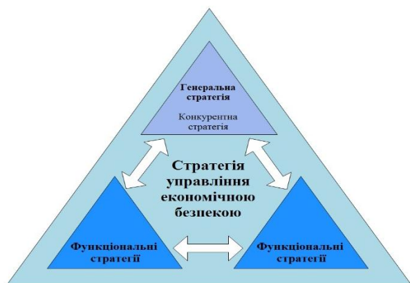
Рис. 1. Місце стратегії управління економічною безпекою підприємства в стратегічному наборі підприємства (авторська розробка)

Забезпечення економічної безпеки підприємства формується за локальними складовими [2, с. 142], які можуть виступати блоками функціональної стратегії, які знаходяться в тісному взаємозв’язку.