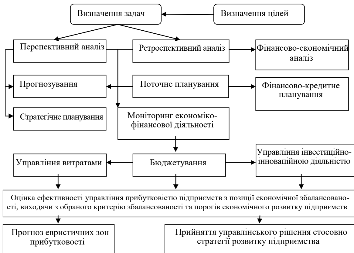
Рисунок 2. Модель стратегічного управління прибутковістю підприємств з позиції економічної збалансованості [9, с. 150]

приємства і як основа для розробки стратегії її забезпечення. Виходячи з третьої формули, регулювати прибутковість власного капіталу (підприємства) можна, використовуючи три фактори. Так, при низькій швидкості обороту активів, збільшити їх прибутковість можна за рахунок зростання цін або зниження собівартості продукції. При низькій прибутковості реалізації слід збільшувати швидкість обороту капіталу підприємства. Або можна маніпулювати показником фінансового левеїджа, який відображає механізм дії на суму і рівень прибутку, зміни співвідношення власних і позикових фінансових коштів. Проте, виходячи тільки з математичної формули моделі, може здатися, що нескінченне збільшення фінансового важеля призводитиме до такого ж нескінченного збільшення прибутковості власного капіталу, але при збільшенні частки позикових засобів в авансованому капіталі зростають і виплати за користування кредитами. Внаслідок цього зменшується чистий прибуток і підвищення прибутковості власного капіталу не відбувається. Тому важливим, при вживанні даної моделі є визначення меж, в рамках яких можна змінювати показники третьої формули, щоб зрештою результуючий показник мав позитивну тенденцію, а рівень підприємницького ризику був прийнятний [1, с. 75; 5, с. 29].