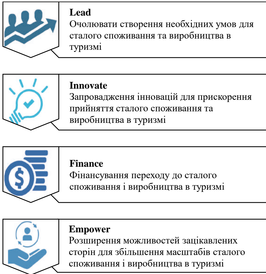
Рис. 3. Важелі дій програми «Єдина планета – Сталий туризм» (складено автором за даними [22])

Програма «Єдина планета – Сталий туризм» діє як партнерство з багатьма зацікавленими сторонами, яке сприяє обміну знаннями та створенню мереж, а також надає вказівки та рекомендації для вирішення колективних пріоритетів. Програма наразі зосереджена на трьох основних сферах діяльності: