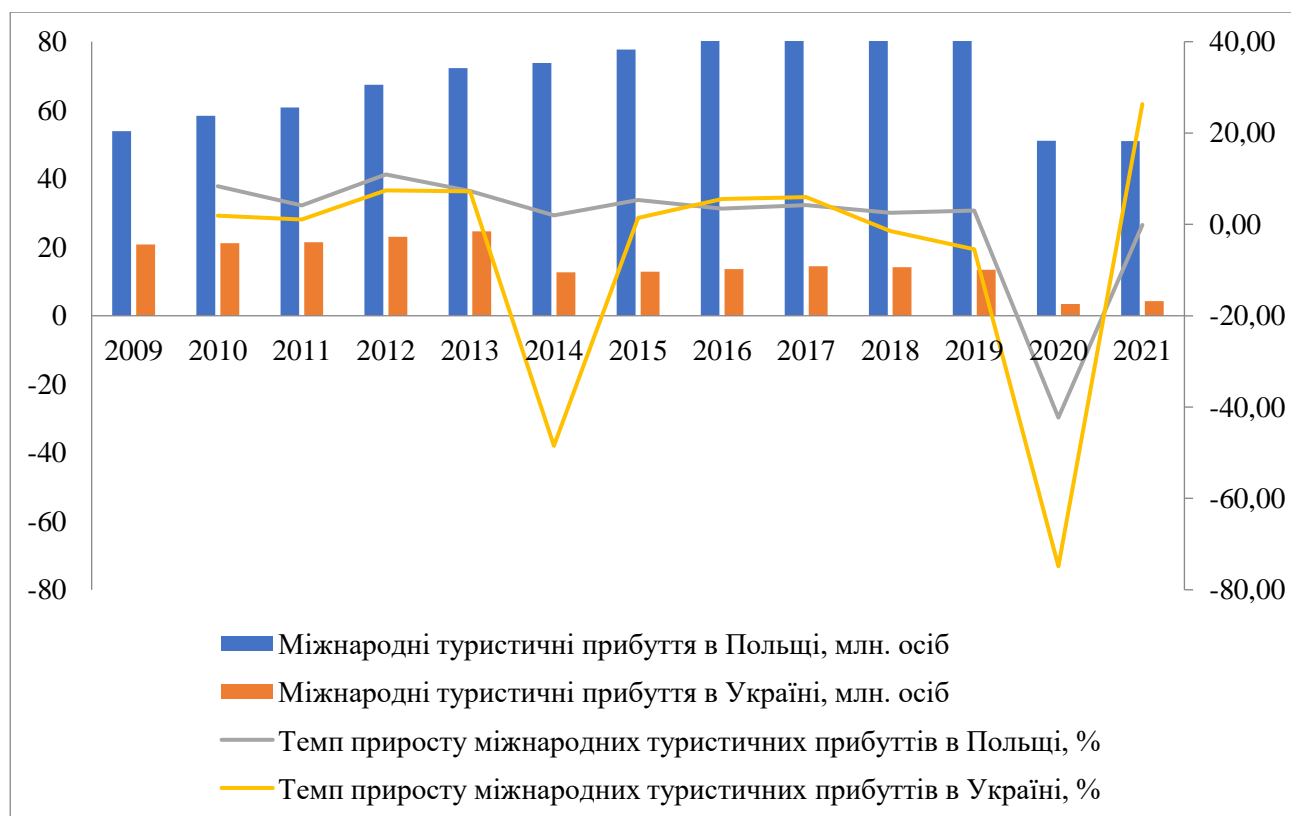
Рисунок 1 – Компаративний аналіз динаміки міжнародних туристичних прибуттів в Україні та Республіці Польща, млн. осіб

Аналіз динаміки міжнародних туристичних прибуттів в Республіці Польща у 2009-2021 рр. дозволяє виокремити дві фази розвитку, а саме стає зростання (2009-2019 рр.) та стрімкий спад (2020-2021 рр.). За період 2009-2019 рр. кількість міжнародних туристичних прибуттів збільшилась на 64,3%, що склало 34,66 млн. осіб. Найбільший приріст кількості міжнародних відвідувач зафіксовано у 2012 р. (10,93%, 6,64 млн. осіб.), що пов'язано із проведенням Чемпіонату Європи з футболу 2012 р. в Польщі та Україні. COVID-19 та карантинні обмеження призвели до суттєвого скорочення міжнародних туристичних потоків. Так, обсяги міжнародних туристичних прибуттів в Польщі у 2020 р. склали 51,07 млн. осіб проти 88,5 млн. осіб. у 2019 р. (скорочення становило 42,2%, 37,4 млн. осіб) (рис. 1).