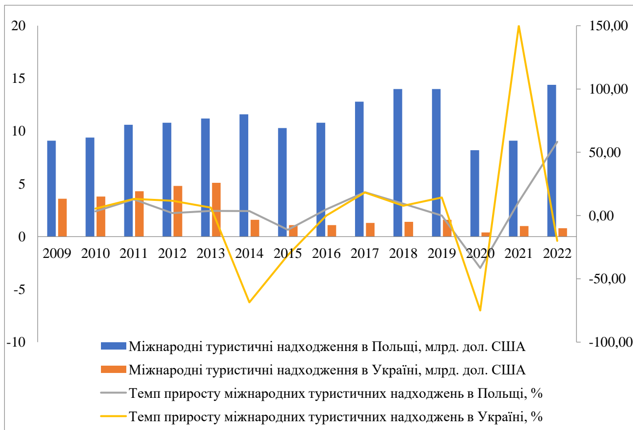
Рисунок 2 – Компаративний аналіз динаміки міжнародних туристичних надходжень в Україні та Республіці Польща, млн. дол. США

Республіці Польща дозволяє констатувати відсутність сталої тенденції, з огляду на наявність низки піків та спадів в аналізованій вибірці даних. Констатуючи загальну позитивну тенденцію, оскільки міжнародні туристичні надходження в Республіці Польща за 2009-2022 рр. збільшилися на 58,24% (5,3 млн. дол. США), в тренді було зафіксовано два суттєвих зниження. Так, у 2015 р. надходження зменшилися на 11,21% (1,3 млн. дол. США) та у 2020 р. – на 41,3% (5,8 млн. дол. США). Піковими роками за обсягом міжнародних туристичних надходжень були 2018, 2019 та 2022 рр. (14 млн. дол. США, 14 млн. дол. США та 14,4 млн. дол. США відповідно). Якщо топові значення 2018 та 2019 рр. відповідали та підтверджували загальносвітові тенденції збільшення туристичних надходжень, то безпрецедентне зростання 2022 р. (58,2%; 5,3 млн. дол. США) безпосередньо пов'язано з еміграцією населення з України (рис. 2).