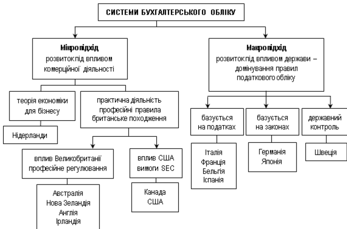
Рисунок 1.1 - Класифікація систем бухгалтерського обліку за Ноубсом