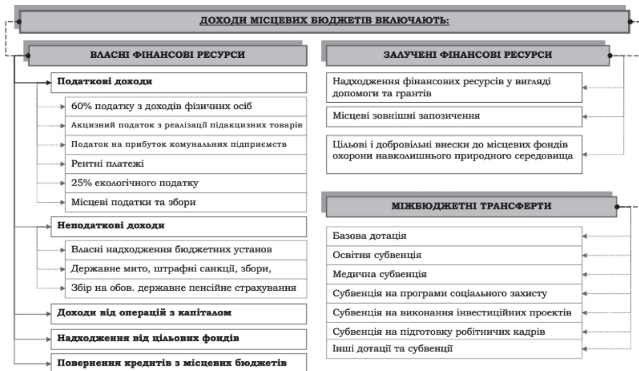
Рис. 2. Схема формування доходів місцевих бюджетів в Україні [5]

платежі (податки і збори) та частки контингенту їх надходжень, які мобілізуються на відповідній території, зокрема: податкові надходження; неподаткові надходження; доходи від операцій з капіталом; доходи від власності та підприємницької діяльності; власні надходження бюджетних установ; трансферти, інші неподаткові надходження» [2].