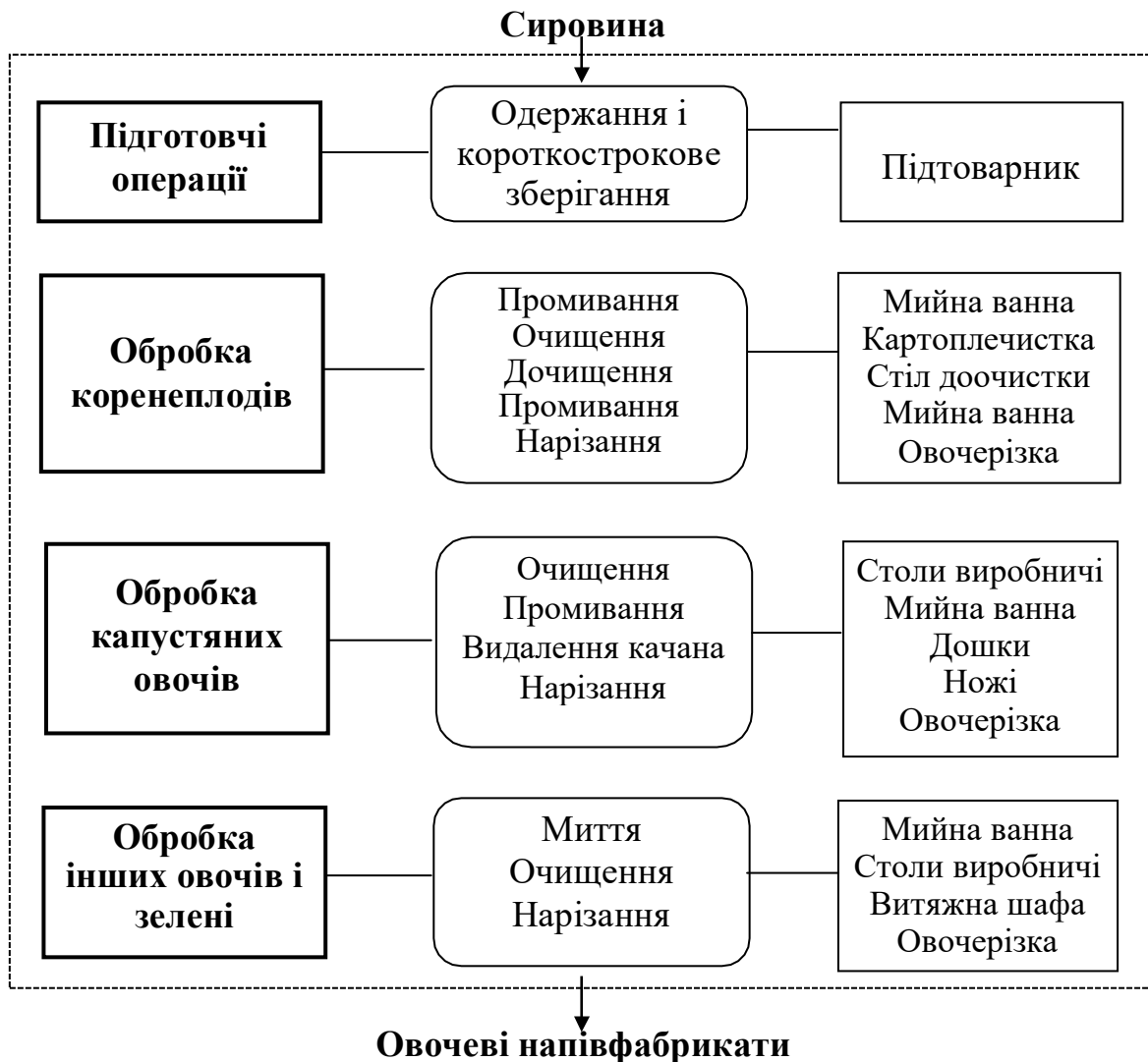
Рис. 3.2 – Принципова схема виробничого процесу овочевого цеху

4.6 Охарактеризувати відповідність вимогам послідовності організації технологічного процесу, функціональне призначення відокремлених технологічних зон основних та допоміжних виробничих приміщень, а також їх взаємозв'язок з іншими приміщеннями підприємства.