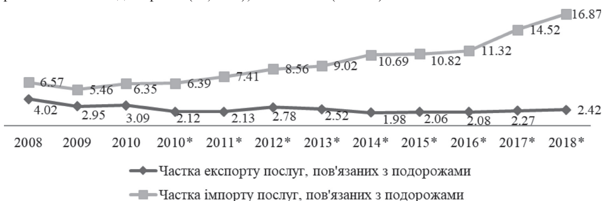
Рис. 2. Частка експорту та імпорту послуг, пов'язаних з подорожами, в загальному експорті та імпорті послуг в Україні, % (побудовано за даними Держкомстату України [12])

Проаналізуємо ефективність торгівлі послугами, пов'язаними з подорожами, в Україні (табл. 2).