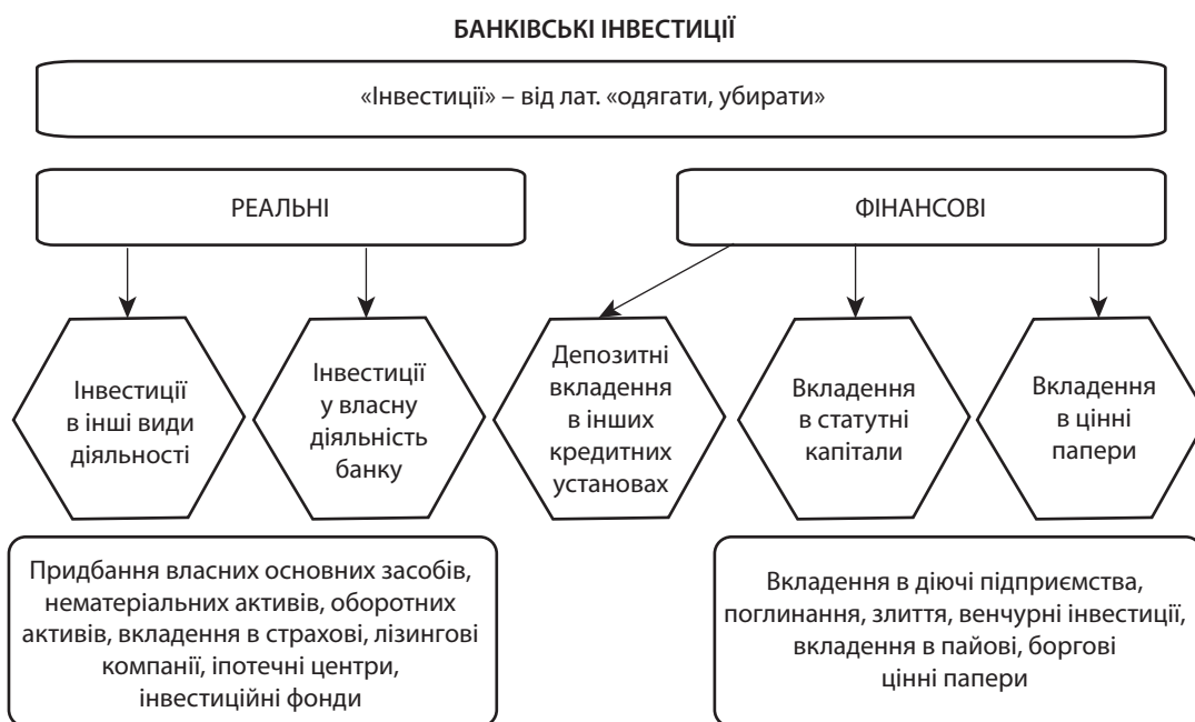
Рис. 1. Види банківських інвестицій

Взагалі, вкладення коштів у цінні папери за значністю та розмірами посідають друге місце після кредитної діяльності серед активних операцій банків. Міжнародний досвід показує, що існує тенденція спрямування