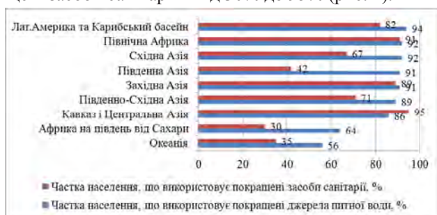
Рис. 3. Використання покращених джерел питної води та санітарії в 2012 р.

2. Сектор ВСГ. За даними доповіді, присвяченої результатам глобальної оцінки стану санітарії та питного водопостачання у рамках Механізму «ООН – Водні ресурси» (ГЛААС) (2014 р.), значний прогрес був досягнутий за останнє десятиліття: 2,3 млрд. людей отримали доступ до покращених джерел питної води протягом 1990–2012 рр. [17, с. 2]. У 2012 р. частка населення, що використовує покращені джерела питної води, варіювалася від 56% до 94%, покращені засоби санітарії – від 30% до 95% (рис. 4).