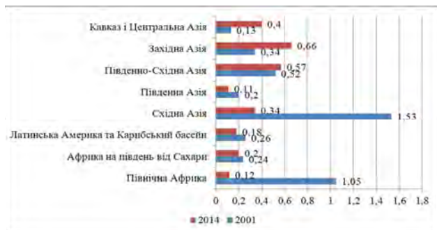
Рис. 2. Показник орієнтації на сільське господарство за регіонами

регіонів світу, протягом 2001–2014 рр. відбулося найвище падіння зазначеного показника. Так, у країнах Східної Азії ПОСГ знизився з 1,53 до 0,34, Північної Африки – з 1,05 до 0,12. Значне зниження показника спостерігалось в країнах Південної Азії (з 0,2 до 0,11), Латинської Америки та Карибського басейну (з 0,26 до 0,18), Африки на південь від Сахари (з 0,24 до 0,2). Найбільш орієнтованими на сільське господарство в 2014 р. є такі регіони, як Західна Азія, Південно-Східна Азія, Кавказ і Центральна Азія, Східна Азія. Найменше значення ПОСГ – у країн Південної Азії (0,11) і Північної Африки (0,12).