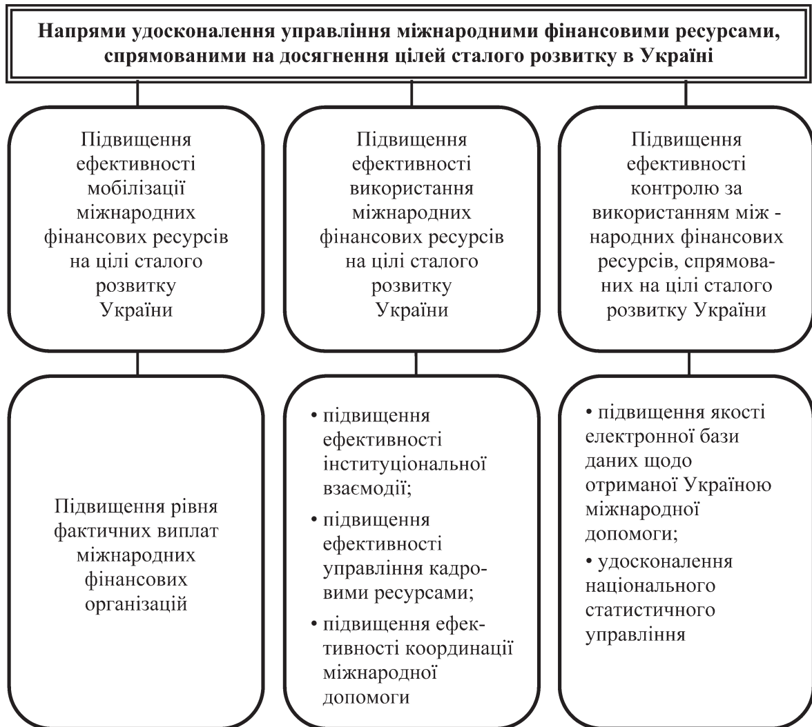
Рисунок 2 — Напрями удосконалення управління міжнародними фінансовими ресурсами, спрямованими на досягнення цілей сталого розвитку в Україні (складено автором)

Підвищення ефективності мобілізації міжнародних фінансових ресурсів на цілі сталого розвитку України та збільшення їх загальних обсягів потребує підвищення рівня