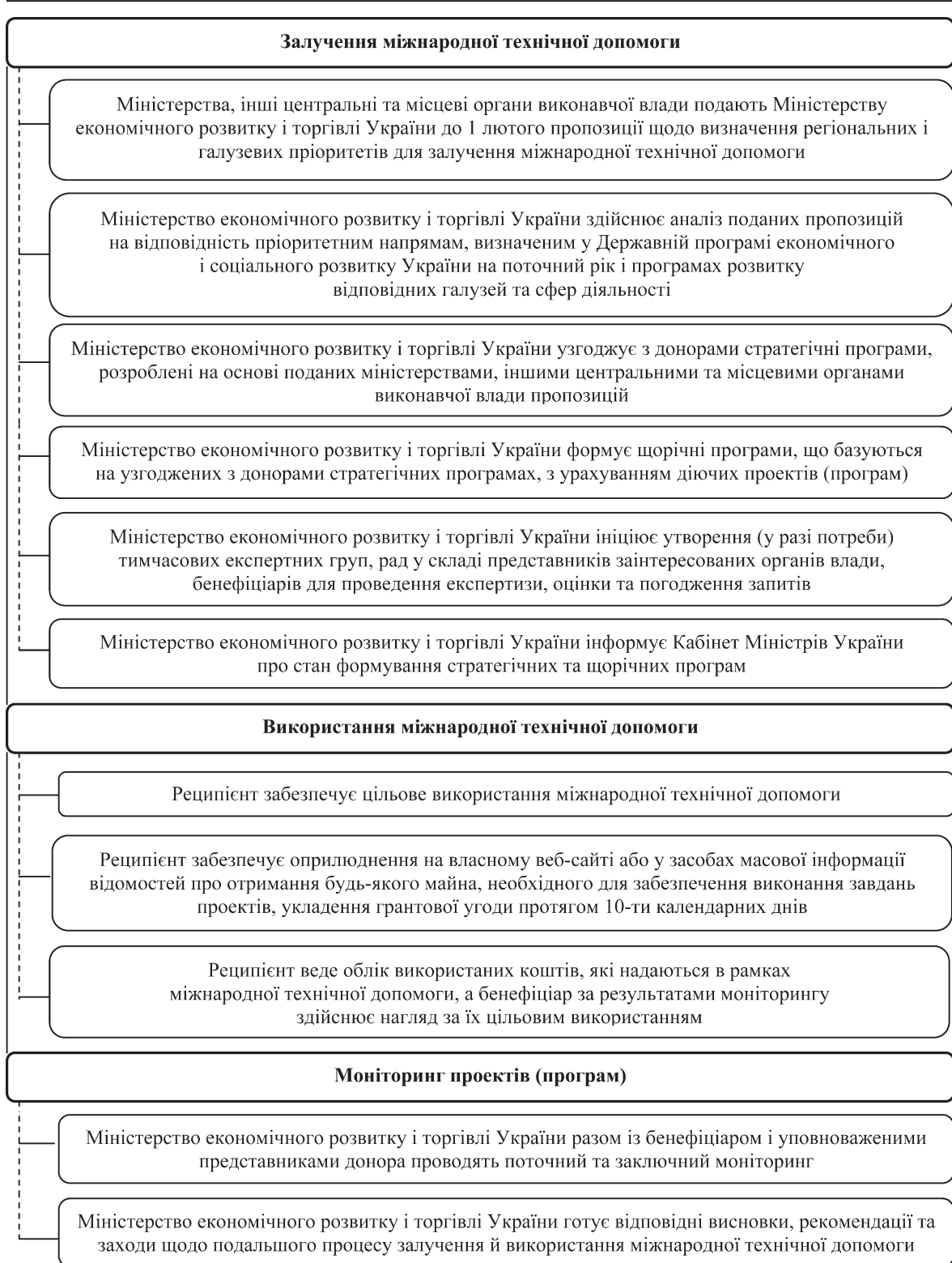
Рисунок 3 — Порядок залучення, використання та моніторингу міжнародної технічної допомоги в Україні (складено автором на основі [9])

пи реалізації проекту (програми); поетапна оцінка стану реалізації проекту (програми); причини виникнення проблем в реалізації проекту (програми); сума освоєних міжнародних фінансових ресурсів; результати реалізації проекту (програми) відповідно до визначених на початку кількісних та/або якісних критеріїв; конкретний вплив проекту (програми) на розвиток відповідної галузі або регіону. Це дозволить забезпечити прозорість та підзвітність уряду, покращити урядовий та громадський контроль, що, у свою чергу,