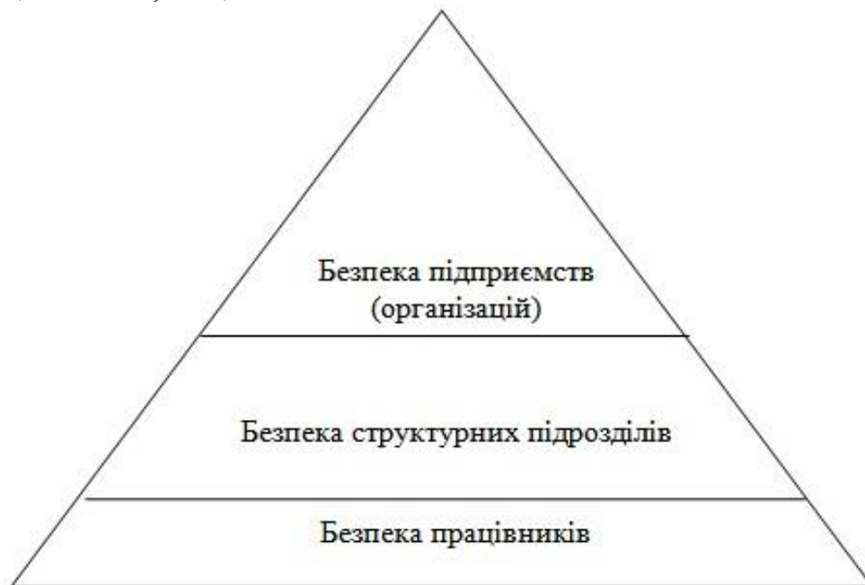
Рис. 2. Рівні безпеки

Загалом, працівники залишаються невід'ємною частиною (елементом) підприємства, яка істотно впливає не тільки на функціонування, але й на діяльність самої організації (рис. 2).