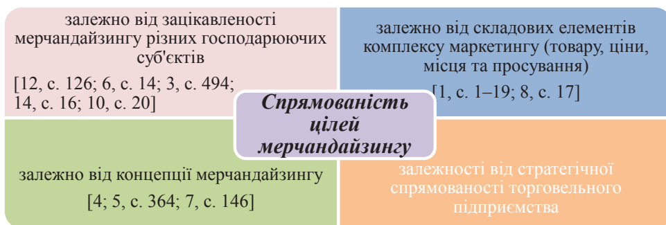
Рис. 2. Спрямованість цілей мерчандайзингу