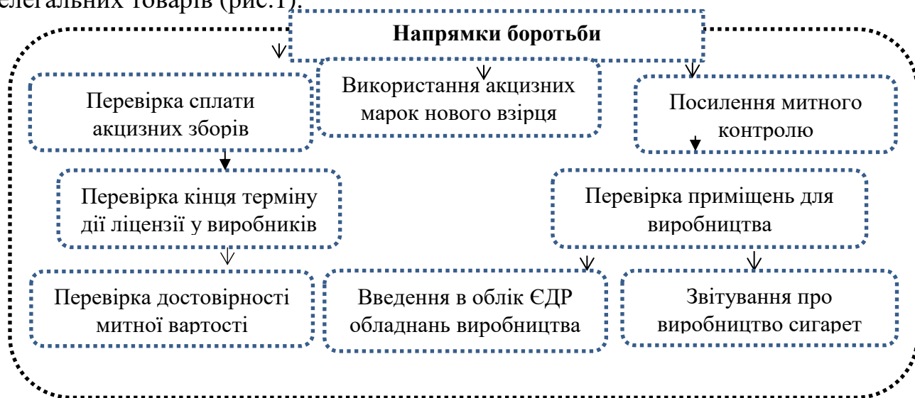
Рис. 1. Напрямки боротьби з контрабандою тютюнових виробів

На сьогоднішній день законодавцем запроваджені деякі вдосконалення інструментів регулювання тютюнового обігу в Україні, які зможуть зменшити транзит через країну, виробництво та імпорт нелегальних товарів (рис.1).