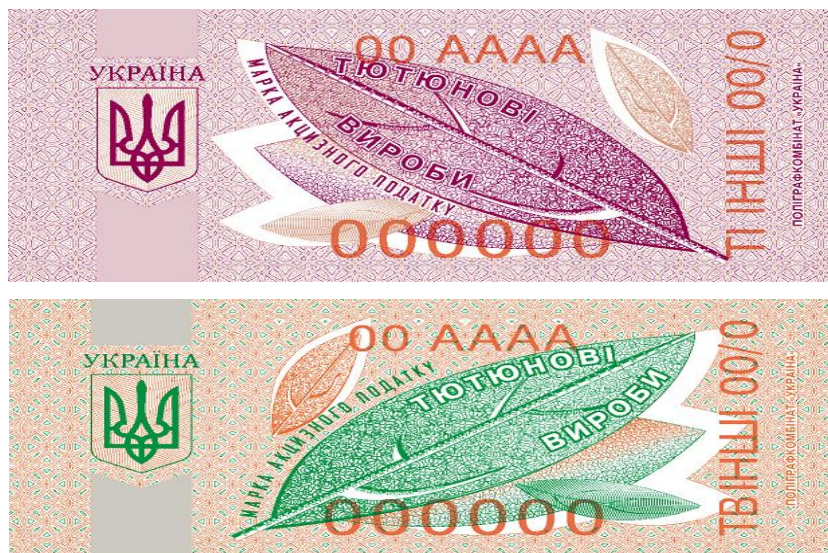
Рис. 2. Взірці нових акцизних марок на тютюнову продукцію

акцизна марка, помаранчева марка – для іншої тютюнової продукції вітчизняного виробництва (рис. 2). Імпортне виробництва сигарет з фільтром та без нього – позначається синім кольором, інші ж вироби для імпорту мають бордовий колір [9].