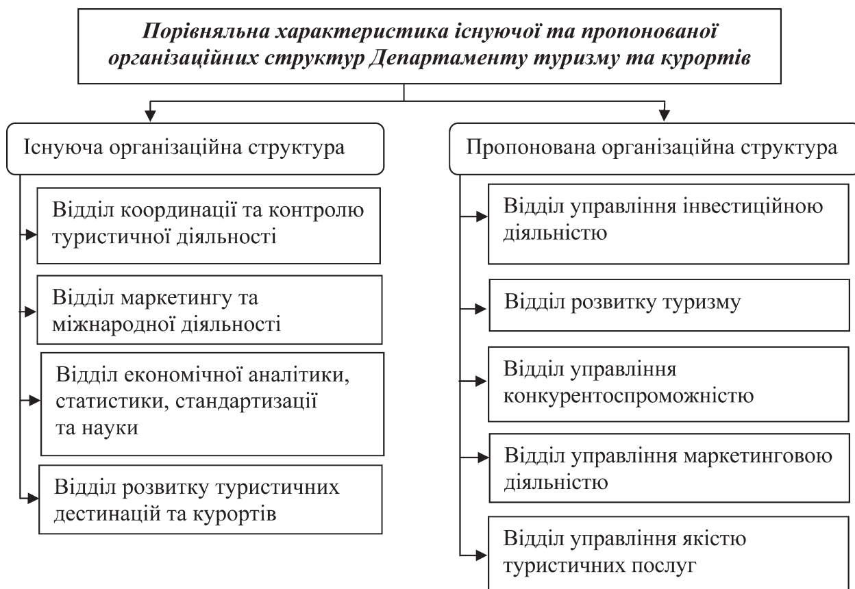
Рис. 2. Порівняльна характеристика існуючої та пропонованої організаційних структур Департаменту туризму та курортів [5]

1. Розроблення і реалізація концепції, що забезпечує функціонування ринку туристичних послуг.