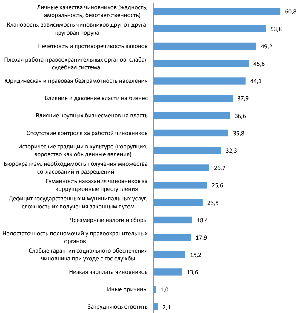
Рис.1. Основные причины взяточничества в регионе, по мнению жителей, %.

следования являлось установление основных причин взяточничества, по мнению жителей, на территории Мурманской области. Наибольшее количество голосов получили: личные качества чиновников (жадность, аморальность, безответственность) (60,8%), а также клановость чиновников, их зависимость друг от друга, круговая порука (53,8%), нечеткость и противоречивость законов (49,2%), плохая работа правоохранительных органов, слабая судебная система (45,6%), юридическая и правовая безграмотность населения (44,1%), влияние и давление власти на бизнес (37,9%), влияние крупных бизнесменов на власть (36,6%), отсутствие контроля за работой чиновников (35,8%), исторические традиции в культуре (коррупция, воровство как обыденные явления) (32,3%), бюрократизм, необходимость получения множества согласований и разрешений (26,7%), гуманность наказания чиновников за коррупционные преступления (25,6%), дефицит государственных и муниципальных услуг, сложность их получения законным путем (23,5%), чрезмерные налоги и сборы (18,4%), недостаточность полномочий у правоохранительных органов (17,9%), слабые гарантии социального обеспечения чиновника при уходе с гос.службы (15,2%), низкая зарплата чиновников (13,6%), иные причины (1,0%), затрудняюсь ответить (2,1%).