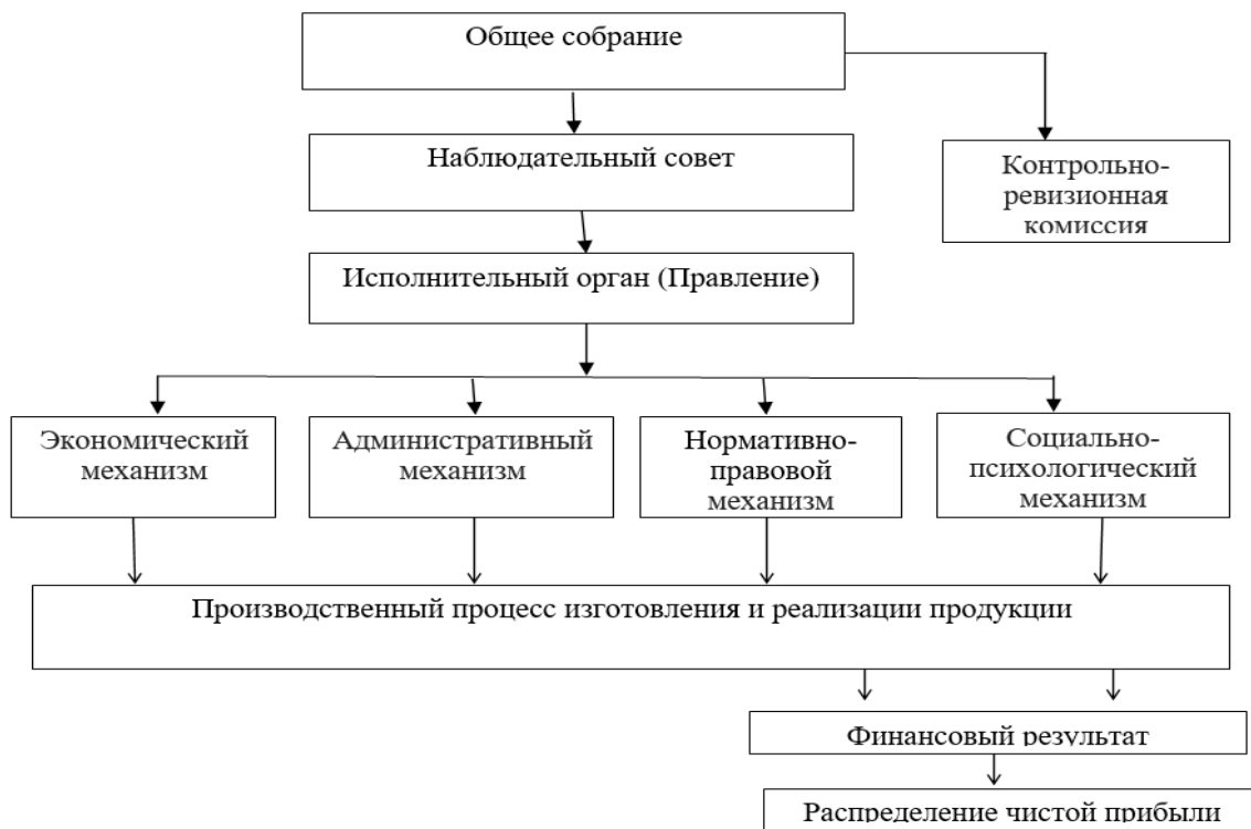
Рисунок 1. Хозяйственный механизм акционерного общества [7, с. 198]

Это акционерные общества, общества с ограниченной и дополнительной ответственностью. Их удельный вес на начало 2018 года составлял 48%. [6, с. 109]. Именно для таких предприятий, где управление отделено от собственности и рассмотрим тенденции в изменении хозяйственного механизма на примере акционерного общества, представленного на рисунке 1.