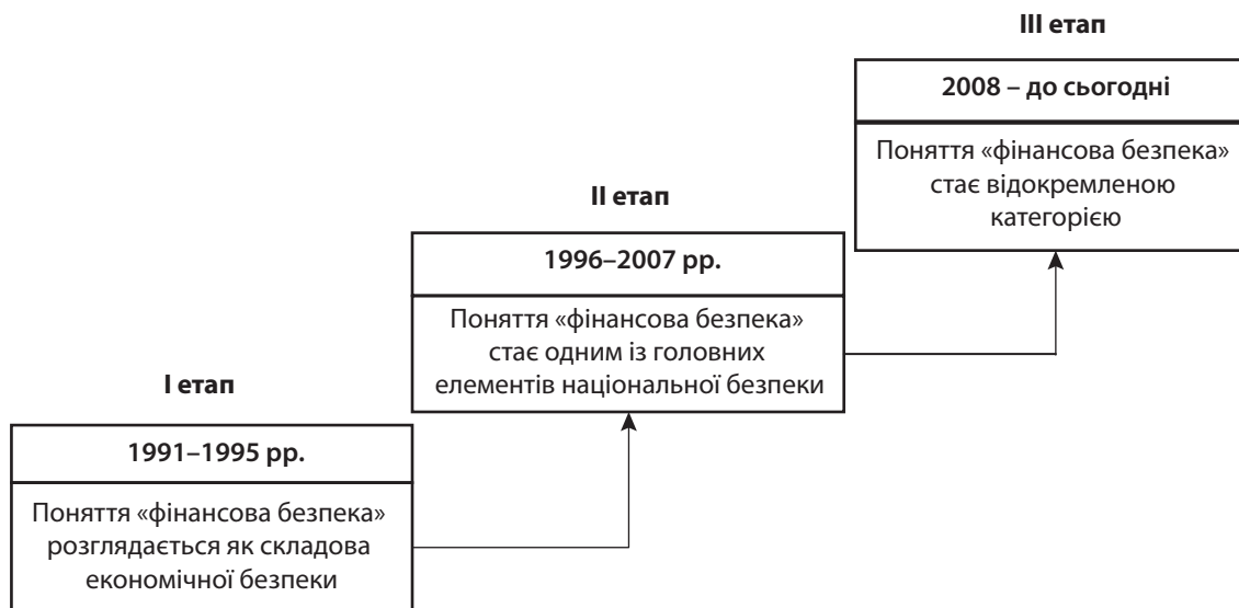
Рис. 1. Етапи еволюції поняття «фінансової безпеки»

Отже, дана категорія пройшла три головні етапи становлення, і з кожним наступним періодом її значущість ставала все більшою. На сьогодні фінан-