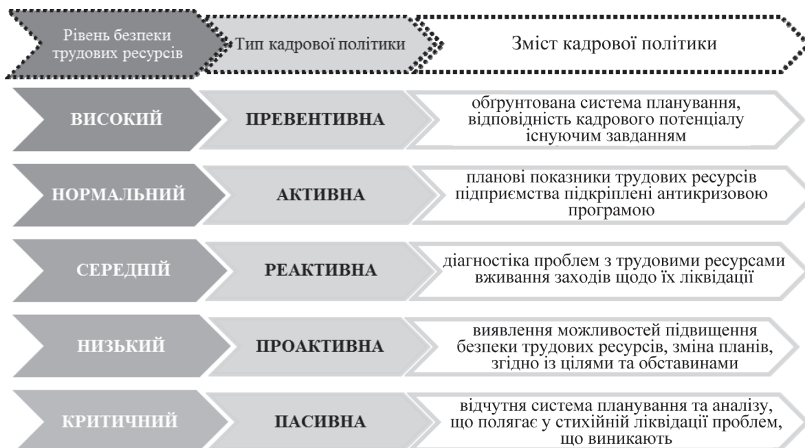
Рисунок 2 — Механізм формування кадрової політики на основі стану безпеки трудових ресурсів добувного підприємства (складено авторами на основі [1, с. 237; 3])

Висновок. У результаті проведених досліджень здійснено оцінку стану безпеки трудових ресурсів добувних підприємств Криворізького басейну протягом 2015–2017 рр. відносно досягнення ними максимально можливого рівня. На половині підприємств, з обраної сукупності, виявлено позитивну динаміку, в одному випадку спостерігається стабільність безпеки трудових ресурсів, в другому — зниження.