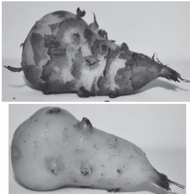
Рисунок 3 — Зразки топінамбура під час проведення комбінованого процесу очищення: а — після попередньої термічної обробки; б — після механічної доочистки

Обробка бульбоплодів парою тиском нижче 0,3 МПа також не забезпечувалі необхідного відділення шкірки від бульби. Під час проведення експериментальних досліджень стосовно визначенням впливу пари на поверхневий шар максимальне значення тиску пари становило 0,7 МПа. Такий тиск передбачає можливість використання апарату для очищення бульбоплодів комбінованим способом на підприємствах ресторанного господарства.