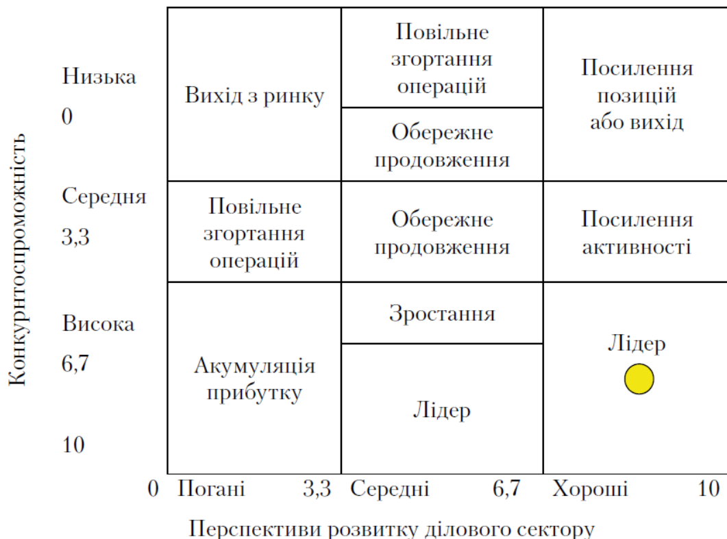
Рисунок 2 – Матриця «галузева привабливість — конкурентоспроможність» ПАТ «Телекомунікації»

Використовуючи дані, побудуємо матрицю — «галузева привабливість — конкурентоспроможність» («Shell» — DPM) (рис. 2).