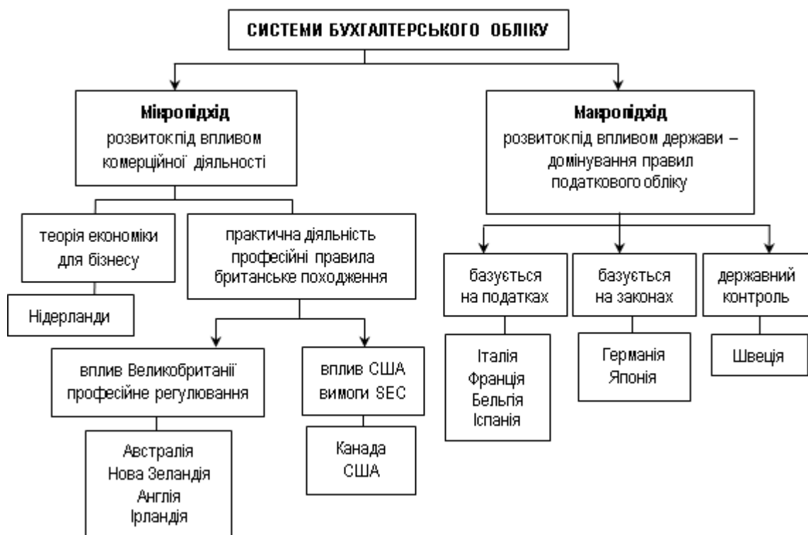
Рисунок 1.1 - Класифікація систем бухгалтерського обліку за Ноубсом