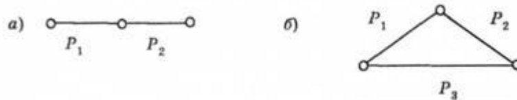
Рис. 5.1. Граф: а - відкритий; б - закритий

Розрізняють відкритий і закритий графи (рис. 5.1). Його ребра свідчать про зв'язок між вершинами. У логістиці туризму це може бути, наприклад, транспортний зв'язок. На ребрах графу можна позначити як відстань (км), так і вартість проїзду (грн), чи категорію шляхів сполучень.