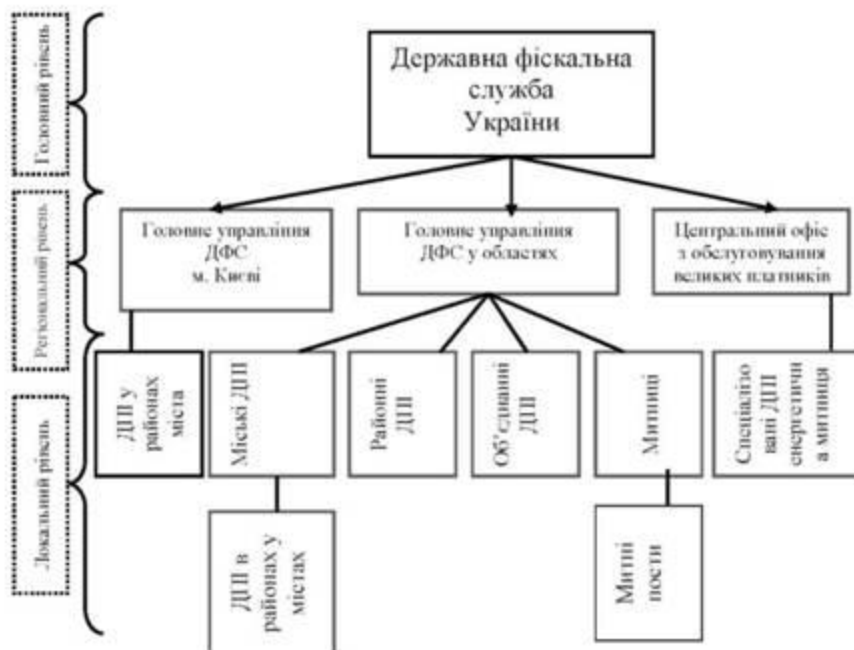
Рис - Структура ДФС України

Необхідно ознайомитись з рисунком та офіційним порталом ДФС (опція « Головна > Про Службу > Структура »). Зазначити, які структурні підрозділи можуть бути у складі ДФС та вказати їх призначення.