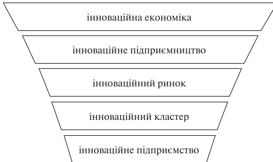
Рисунок 2 — Діалектичний зв'язок елементів інноваційного простору (розроблено автором)

зується на таких моментах: інновації, наукові досягнення, знання) [4, 7], системний (є більш розповсюдженим і базується на розумінні інноваційної економіки як: інноваційних систем, структури, моделі, інституалізації, сфери інформації, сфери знань, технології, соціуму, капіталу) [7, 12, 18], ресурсний (стосується розуміння таких аспектів: творчий людський капітал, інвестиційні ресурси) [5, 11], функціональний (визначає науку, освіту, знання як основні моменти інноваційної економіки) [6, 10].