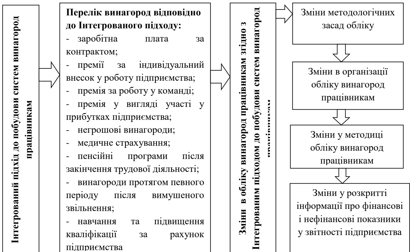
Рис.2 – Вплив Інтегрованого підходу до побудови систем винагород працівникам на облік винагород працівникам*

Розширення складових, які включає в себе Інтегрований підхід до побудови систем винагород працівникам у порівнянні з окремо американським, японським чи європейським, відкриває нові види винагород та оновлене уявлення про об'єкти обліку, що відносяться до процесу винагород працівникам, що приведе до змін в організації і методиці обліку винагород працівникам. Вплив Інтегрованого підходу до побудови винагород працівникам на облік винагород працівникам розглянуто в рис.2.