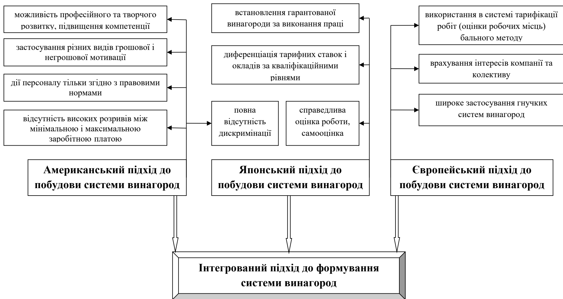
Рис.1 - Формування Інтегрованого підходу до побудови системи винагород працівникам