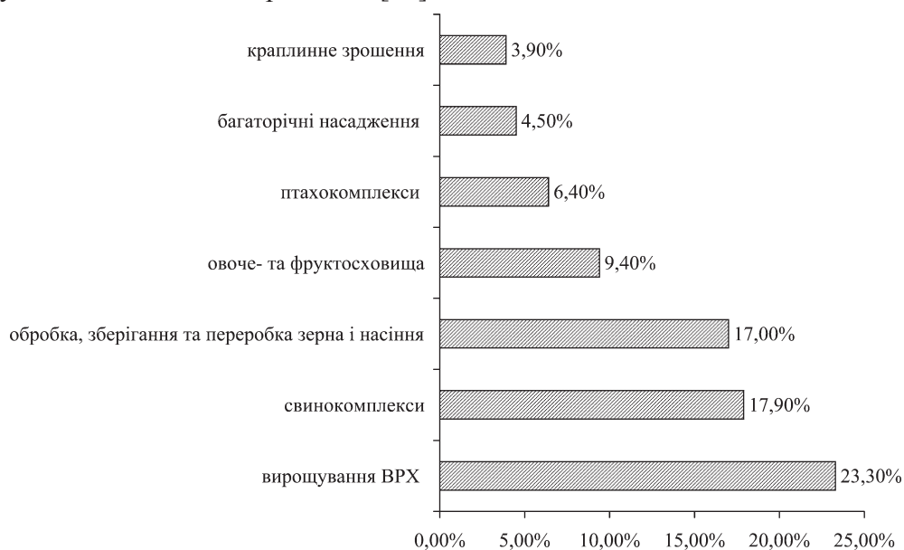
Рисунок 2 — Напрямки реалізації інвестиційних проектів за 2016 рік (сформовано авторами згідно [2,5,6])

Порівняємо кількість проектів у 2016 (рис. 2) і 2017 роках, які реалізувалися і реалізуються за такими напрямками [10]: