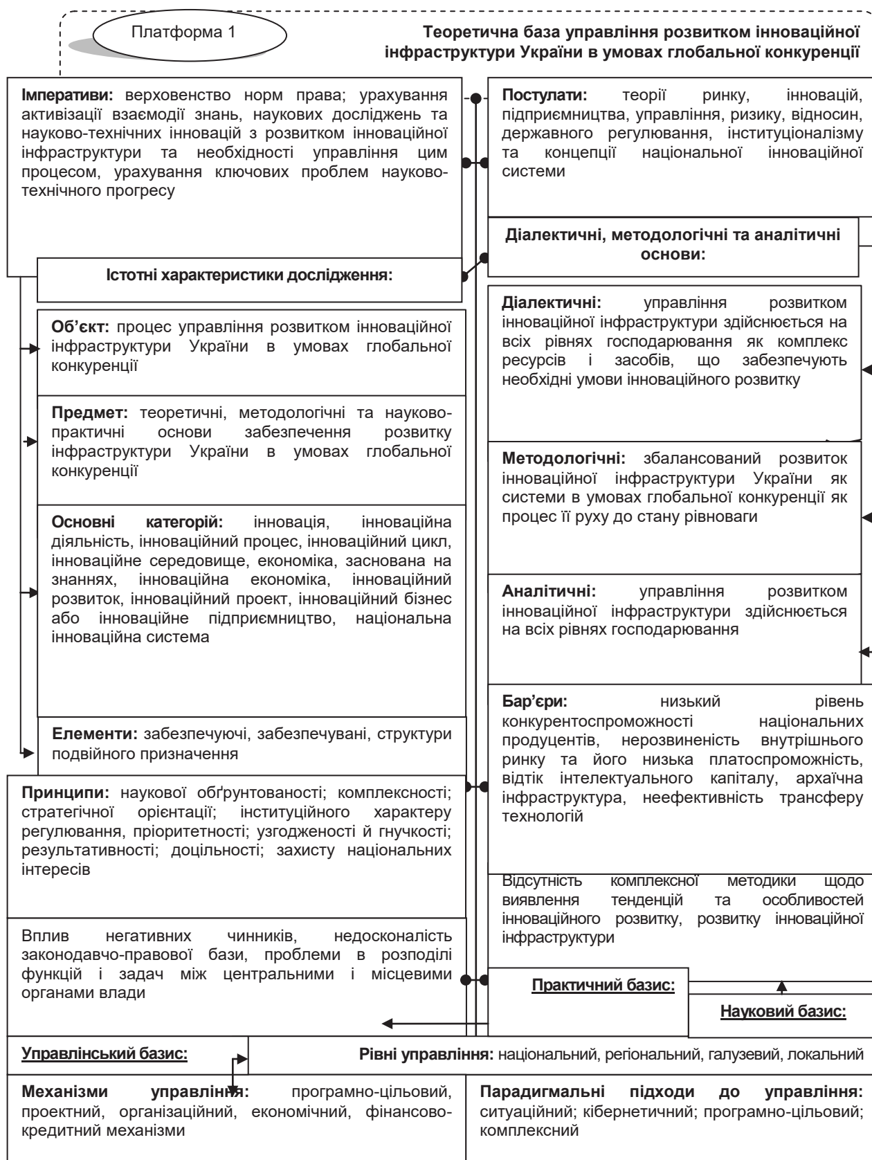
Рис. 2. Концепція управління розвитком інноваційної інфраструктури України в умовах глобальної конкуренції