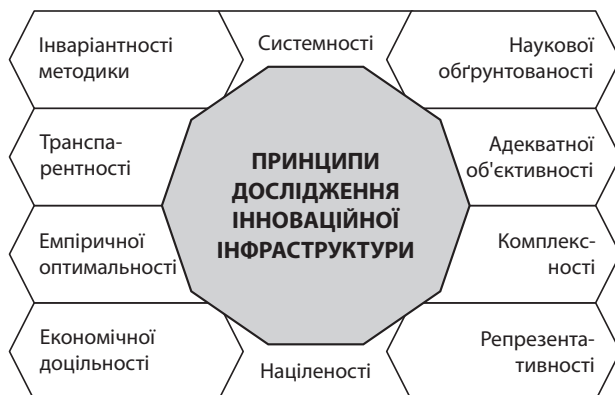
Рис. 2. Принципи дослідження інноваційної інфраструктури